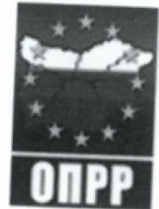
ТАБЛИЦА ЗА ИНДИВИДУАЛНО ОЦЕНЯВАНЕ

Оперативна програма "Регионално развитие" 2007-2013 www.bgregio.eu Инвестираме във Вашето бъдеще!