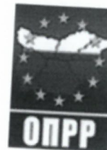
ТАБЛИЦА ЗА ИНДИВИДУАЛНО ОЦЕНЯВАНЕ

Оперативна програма "Регионално развитие" 2007-2013 www.bgregio.eu Инвестираме във Вашето бъдеще!